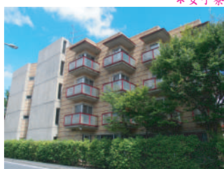
松屋 Residence 修学院